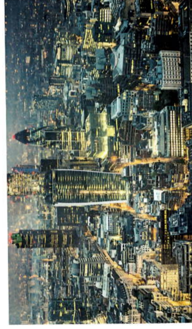
Can of Ham, 70 St Mary Axe, London